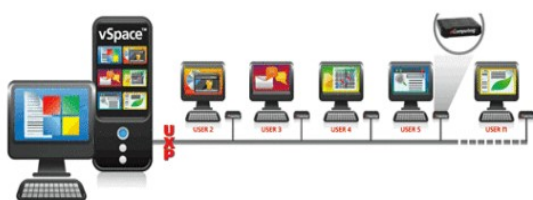
Gambar 1. Rangkaian Teknologi NComputing