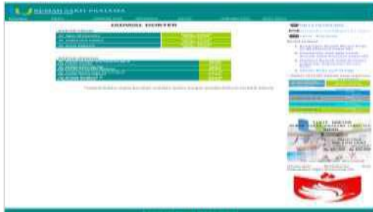
Gambar 10. Tampilan Sub Menu Jadwal Dokter