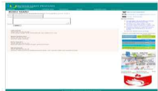
Gambar 14. Tampilan Menu Buku Tamu