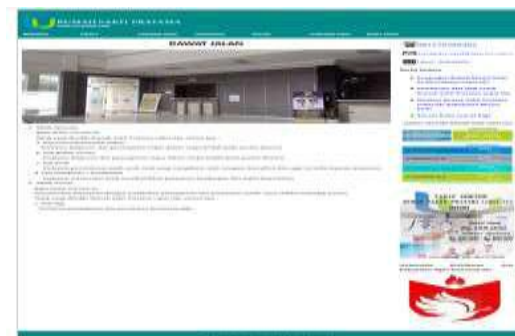
Gambar 8. Tampilan Sub Menu Rawat Jalan