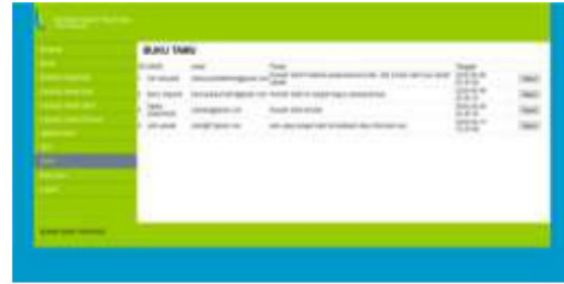
Gambar 25. Tampilan Buku Tamu Admin

Pada halaman ini admin dapat melihat dan menghapus pesan yang tidak layak ditampilkan.