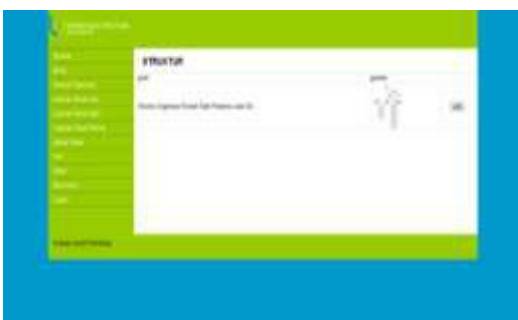
Gambar 18. Tampilan Input Struktur Organisasi

Pada halaman ini admin dapat menginputkan struktur Rumah Sakit Pratama Lubai Ulu.