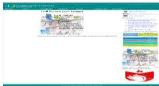
Gambar 11. Tampilan Sub Menu Tarif