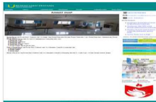
Gambar 7. Tampilan Sub Menu Rawat Inap