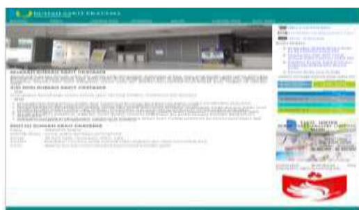
Gambar 5. Tampilan Sub Menu Tentang RS

Pada halaman sub menu tentang RS, berisi sejarah singkat rumah sakit pratama, visi misi rumah sakit dan motto rumah sakit.