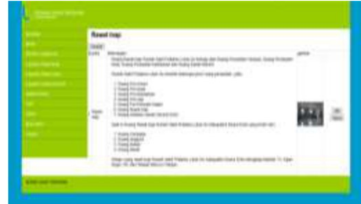
Gambar 19. Tampilan Input Rawat Inap