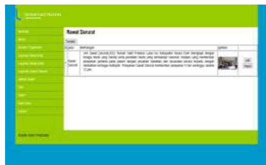
Gambar 21. Tampilan Input Rawat Darurat

Pada halaman ini admin dapat menginputkan rawat darurat Rumah Sakit Pratama Lubai Ulu.