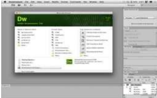
Gambar 2. Tampilan Adobe Dreamweaver CS6

Adobe Dreamweaver CS6 adalah suatu perangkat lunak web editor keluaran Adobe System yang digunakan untuk membangun dan mendesain suatu website dengan fitur - fitur yang menarik dan kemudahan dalam penggunaannya. [2]