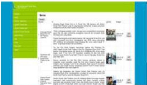
Gambar 17. Tampilan Input Berita

Pada halaman ini admin dapat menginputkan berita-berita Rumah Sakit Pratama Lubai Ulu