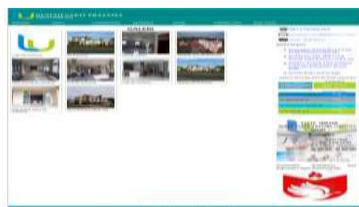
Gambar 12. Tampilan Menu Galeri