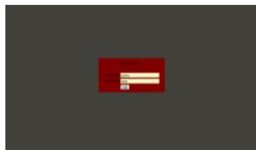
Gambar 15. Tampilan Login Admin

Jika username dan password telah terisi dengan benar, maka akan tampil halaman Beranda Admin.