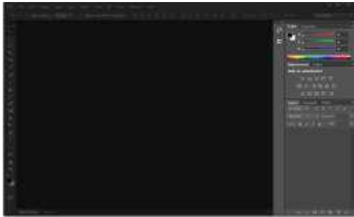
Gambar 3. Tampilan Adobe Photoshop

Adobe Photoshop adalah salah satu software untuk mengolah foto ataupun gambar, dengan adobe photoshop kita dapat memperbaiki dan mempercantik foto yang ingin kita cetak dengan menambahkan efek dalam foto tersebut. [1]