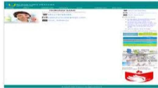
Gambar 13. Tampilan Menu Hubungi Kami