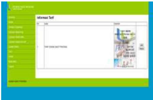
Gambar 23. Tampilan Input Tarif

Pada halaman ini admin dapat menginputkan tarif dokter.