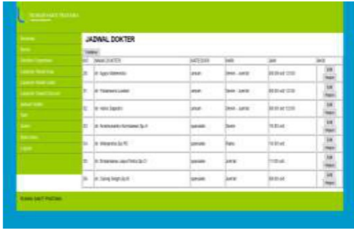
Gambar 22. Tampilan Input Jadwal Dokter