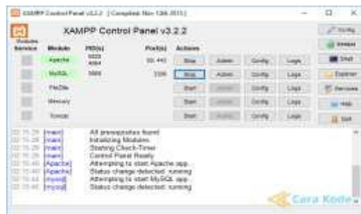
Gambar 1. Tampilan XAMPP

XAMPP adalah perangkat lunak open source yang diunggah secara gratis dan bisa dijalankan di semua system operasi seperti windows , linux , solaris , mac . [5]