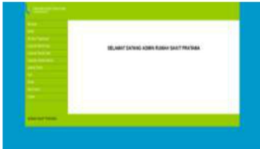
Gambar 16. Tampilan Beranda Admin