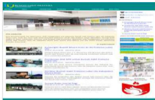
Gambar 4. Tampilan Menu Beranda

menuju kehalaman lain dalam sebuah website .