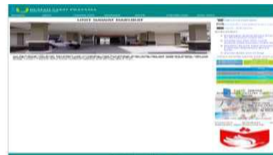
Gambar 9. Tampilan Sub Menu Rawat Darurat