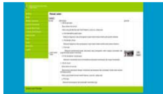
Gambar 20. Tampilan Input Rawat Jalan

Pada halaman ini admin dapat menginputkan rawat jalan Rumah Sakit Pratama Lubai Ulu.