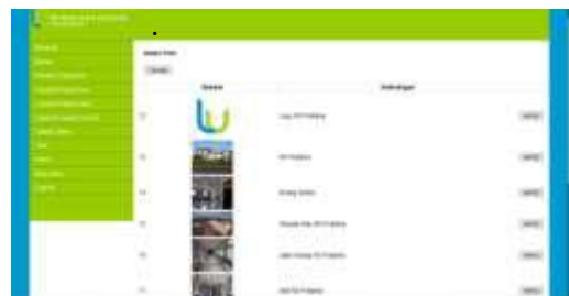
Gambar 24. Tampilan Input Galeri

Pada halaman ini admin dapat menginputkan foto – foto Rumah Sakit Pratama Lubai Ulu Kabupaten Muara Enim.