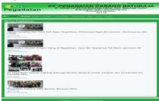
Gambar 13. Tampilan Menu Berita

Halaman ini berisi berita-berita PT. Pegadaian Cabang Baturaja. Tampilannya seperti gambar di bawah ini :