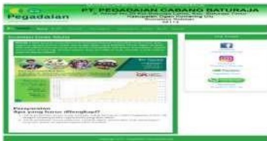
Gambar 7. Tampilan Submenu Investasi Emas