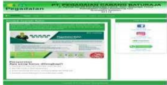
Gambar 8. Tampilan Submenu Produk Syariah