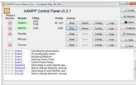
Gambar 17. Tampilan Xampp

b. Buka google Firefox kemudian ketikkan localhost/phpmyadmin .