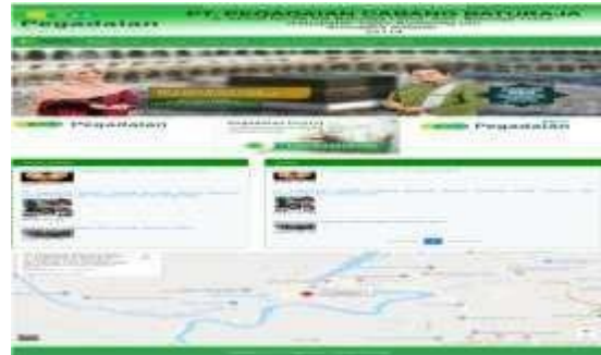
Gambar 1. Tampilan Menu Utama

Hasil penelitian yang dilakukan oleh penulis adalah Website PT. Pegadaian Cabang Baturaja. Website ini terdiri dari Halaman Utama dan Halaman Admin . Halaman utama terdiri dari delapan menu yaitu, Menu Home, Profil, Produk, Tata Kelola, Harga Emas, Galeri, Berita dan Kontak. Halaman Admin terdiri dari enam menu yaitu, Produk, Berita, Galeri, Harga Emas, User dan Keluar.