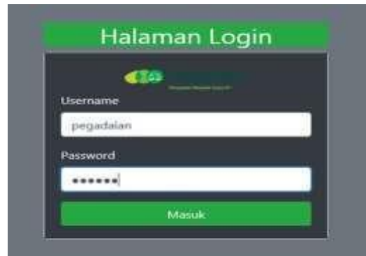
Gambar 15. Tampilan Menu Login

Halaman ini berfungsi untuk mengakses halaman administrator dengan memasukkan username dan password yang telah dibuat di database . Tampilannya seperti gambar di bawah ini :