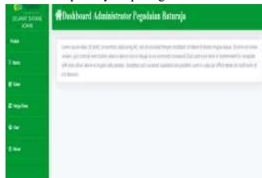
Gambar 16. Tampilan Menu Beranda Admin

ketika admin berhasil melakukan login Administrator , maka akan muncul halaman beranda admin . Tampilannya seperti gambar di bawah ini :