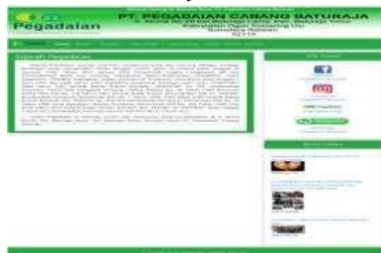
Gambar 3. Tampilan Submenu Sejarah