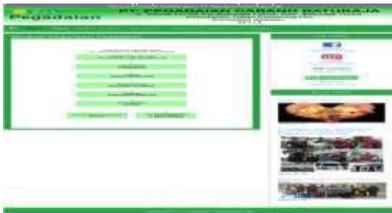
Gambar 5. Tampilan Submenu Struktur Organisasi