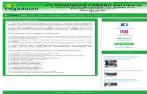
Gambar 9. Tampilan Submenu Kode Etik