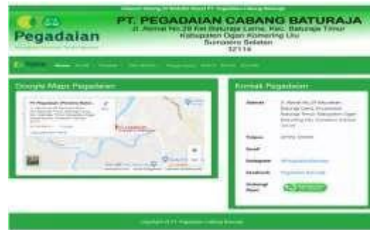
Gambar 14. Tampilan Menu Kontak

Halaman ini berisi Kontak PT. Pegadaian Cabang Baturaja. Tampilannya seperti gambar di bawah ini :