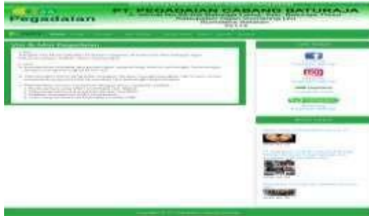
Gambar 4. Tampilan Submenu Visi Misi