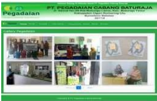
Gambar 12. Tampilan Menu Galeri

Halaman ini berisi foto-foto kegiatan PT. Pegadaian Cabang Baturaja. Tampilannya seperti gambar di bawah ini :