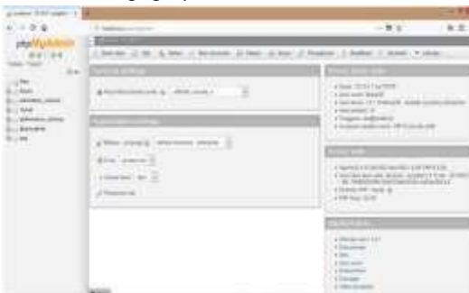
Gambar 18. Tampilan Localhost/PHPMyAdmin

b. Buka google Firefox kemudian ketikkan localhost/phpmyadmin .