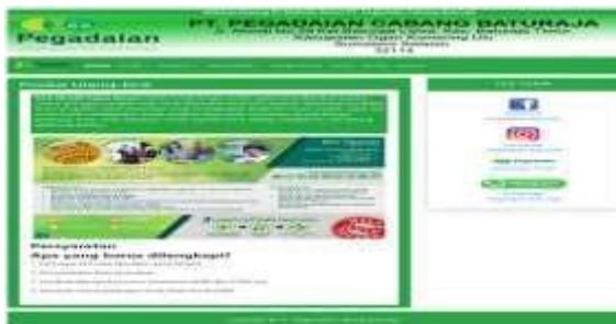
Gambar 6. Tampilan Submenu Produk Utama