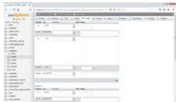
Gambar 21. Tampilan Field Tabel pada Database

e. Lalu isi field , type , dan value , sesuai dengan nama field dan tentukan primary key pada masing-masing tabel. Tabel dan nama tabel selesai dibuat.