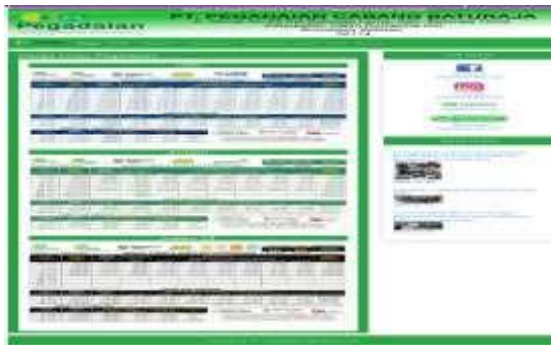
Gambar 11. Tampilan Menu Harga Emas

Halaman ini berisi brosur harga emas pada PT. Pegadaian Cabang Baturaja. Tampilannya seperti gambar di bawah ini :