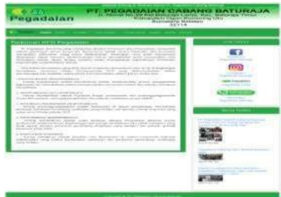
Gambar 10. Tampilan Submenu Pedoman GCG